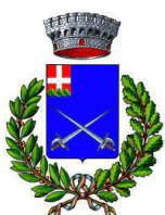
comune di Morozzo