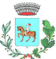
comune di Montanera