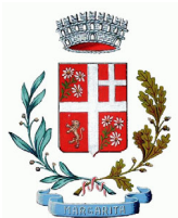
comune di Margarita